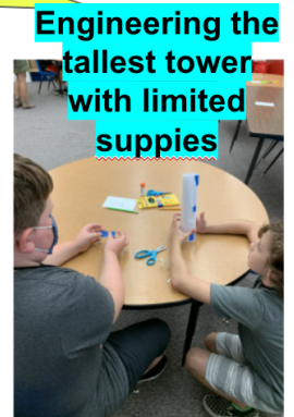
Engineering the tallest tower with limited supplies