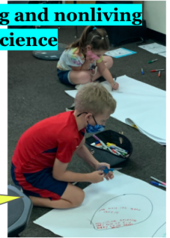
Classifying living and nonliving things in Science