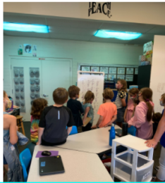
Students sharing their thinking on a math problem- How many combinations of ice cream can you make with ten flavors?